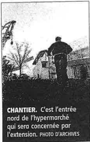
CHANTIER. C'est l'entrée nord de l'hypermarché qui sera concernée par l'extension.

Ce nouvel espace commercial, qui viendra compléter l'offre déclinée par les 17 commerces et services présents dans l'actuelle galerie, débouchera sur un parking agrandi et reconfiguré, passant de 1.055 à 1.630 places de